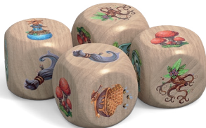
4 ingredient dice