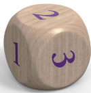
1 number die