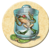
8x ホルマリン漬 けのカエル