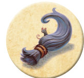
8x トロールの 最高の髪