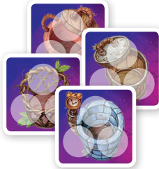
4 ゴミ捨て場カード (two-sided)