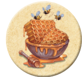
8x 甘くて美味しい 蜂蜜