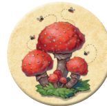
8x 猛毒な ベニテングタケ