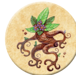
8x 採れたて マンドレイク